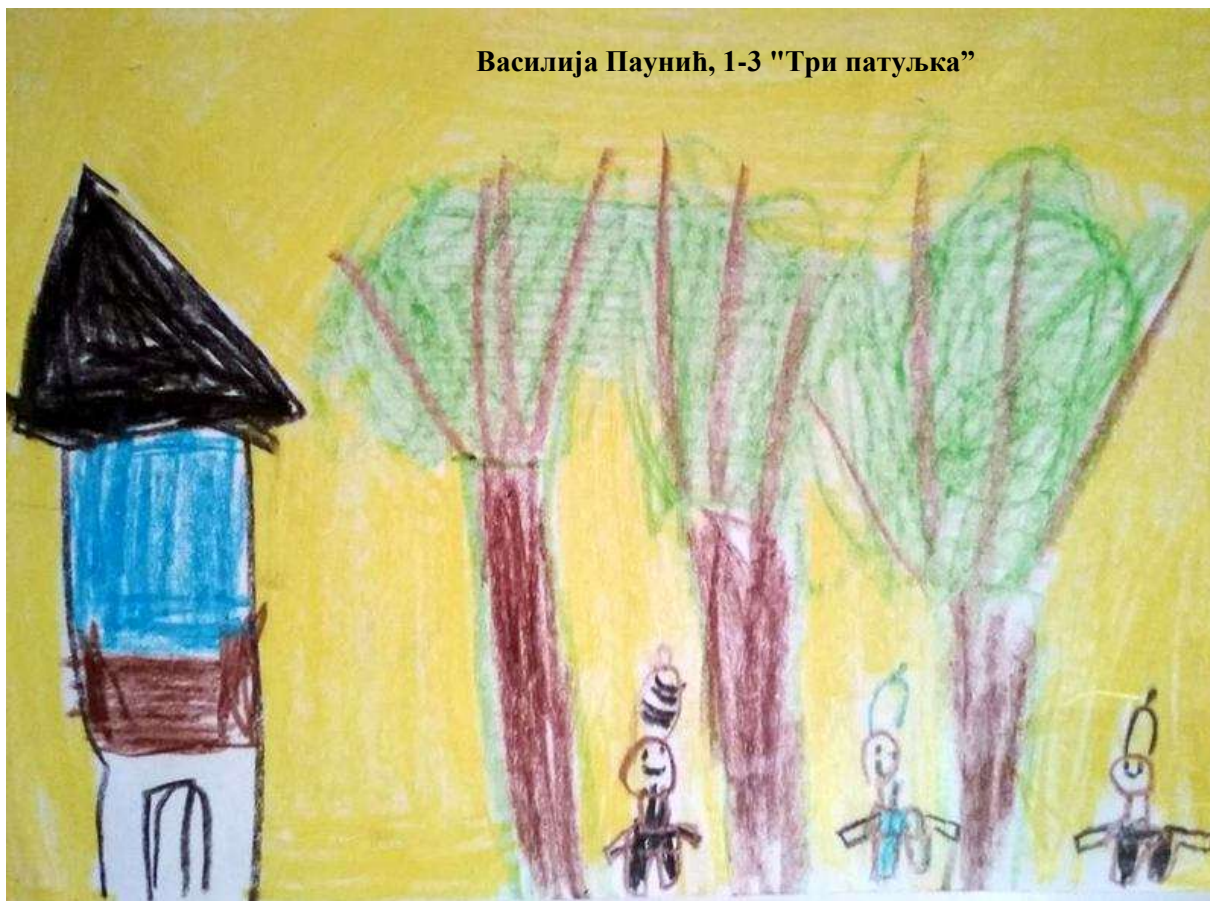
Василија Паунић, 1-3 "Три патуљка"