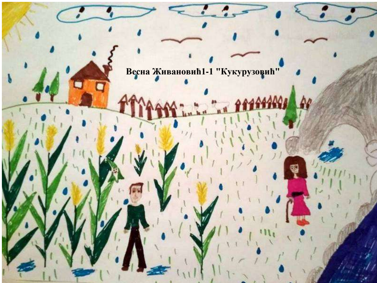
Весна Живановић 1-1 "Кукурузовић"